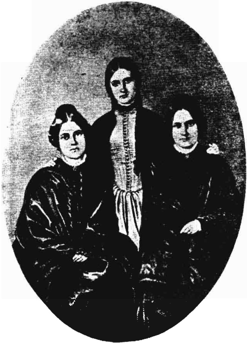
- بنات فوكس . . أشهر ثلاث أخوات في التاريخ . . كن يستمن دقات على الباب وعلى الشباك . . بهذه الدقات ارتفع الستار عن علم جديد هو علم الروح في القرن التاسع عشر .